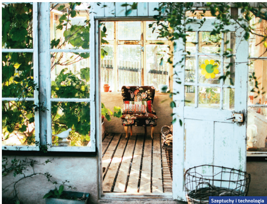
Szeptuchy i technologia