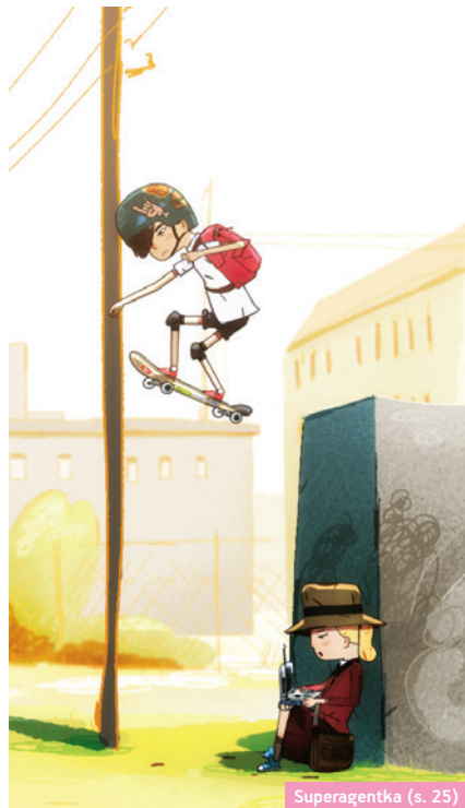
Superagentka (s. 25)

→ 9 sierpnia, godz. 12:00 Dom Ludowy, cena biletu: 5 zł