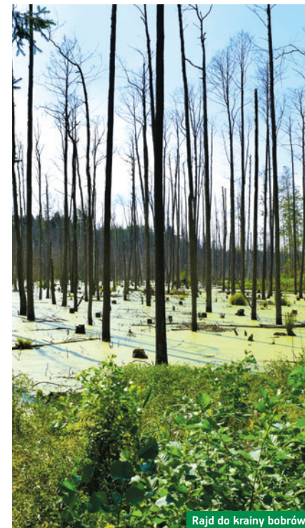
Rajd do krainy bobrów