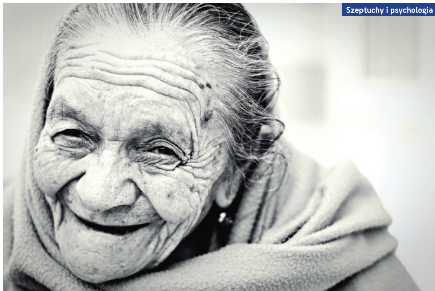
Szeptuchy i psychologia

Podlasie SlowFest przygotowało retrospektywę filmów Ingmara Bergmana w ramach obchodów 100. rocznicy urodzin reżysera. Profesor Szczepański wprowadzi widzów w świat szwedzkiego artysty przed każdym seansem, a w dniu urodzin Bergmana, 14 lipca, wygłosi wykład o jego życiu i twórczości.