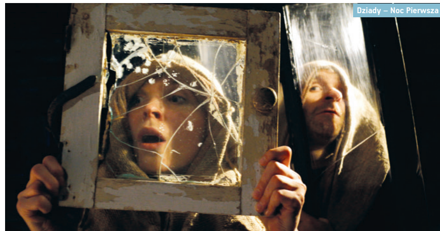
Dziady – Noc Pierwsza

→ 5, 6 lipca, godz. 19:00 Teatr Wierszalin, cena biletu: 40 zł