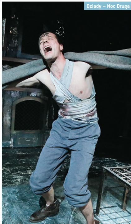
Dziady – Noc Druga