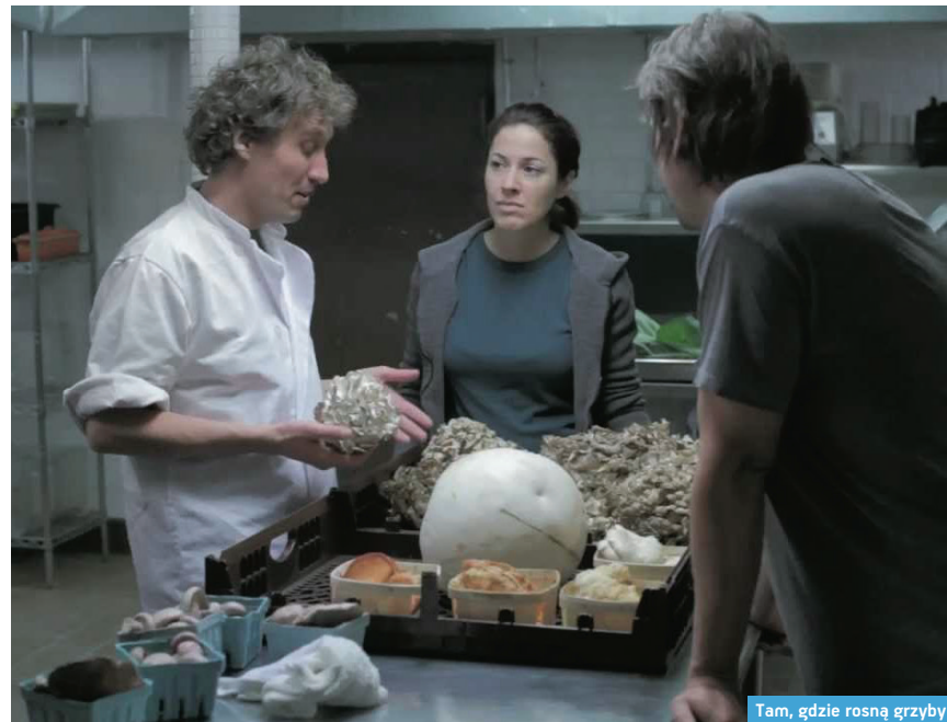
Tam, gdzie rosną grzyby