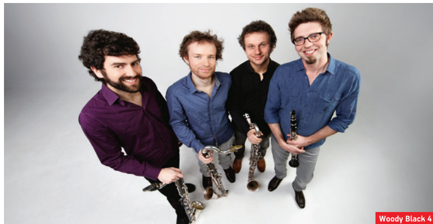
Woody Black 4

To pytanie postawimy czworgu podlaskim twórcom, którzy po pierwsze – zgrabnie wplatają w swoje książki wątki podlaskie, po drugie – ze smakiem i znanstwem sięgają po lokalność lingwistyczną, po trzecie – pięknie opowiadają o tym, co buduje ich (więc i nasz) literacki