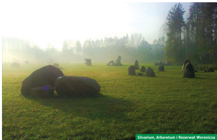
Silvarium, Arboretum i Rezerwat Woronicza

→ 25 lipca, 10 sierpnia, godz. 10:00–13:00 liczba osób: minimum 4 zbiórka: przed Domem Ludowym, cena z własnym rowerem: 40 zł, cena z zapewnionym rowerem: 80 zł