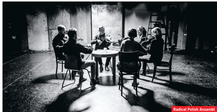
Radical Polish Ansambel