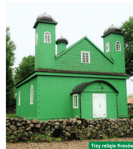
Trzy religie Kresów

→ 3 lipca, 2 sierpnia, godz. 10:00–17:00 liczba osób: minimum 4 zbiórka: parking przed Monasterem, cena: 150 zł