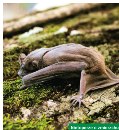
Nietoperze o zmierzchu

Przyjrzyj się nietoperzom o zmierzchu – piją z tafli wody, gonią owady i trenują w tym młode. Wyposażony w detektor nietoperzy przyrodnik pomoże usłyszeć, zobaczyć i zrozumieć mroczki, nocki rude i wszystkie inne, które się pojawiają. Opowie o zwyczajach i bogactwie gatunków w Puszczy Knyszyńskiej. Polecamy ciepły strój i terenowe buty, zapewniamy lornetki.