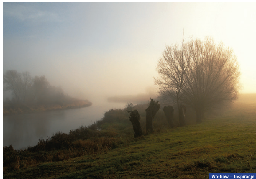
Wołków – Inspiracje

Wiktora Wołkowa w Supraślu przedstawiać nie trzeba. Ten wszechstronny i twórczy fotograf w swojej działalności wykazywał się rzadko spotykaną konsekwencją i determinacją.