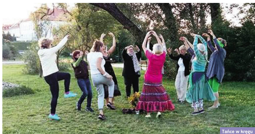
Tańce w kręgu